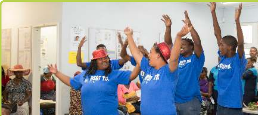
Die Beat TB Dramagroep in aksie by Empilisweni Kliniek, Worcester